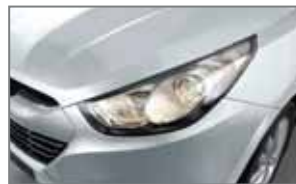
Machine silver 9S