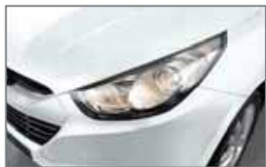
Cassa White WD