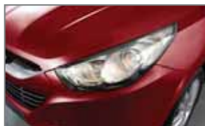
Infra Red AA1