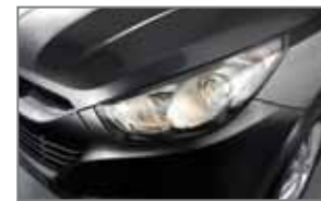
Black Pearl 1K