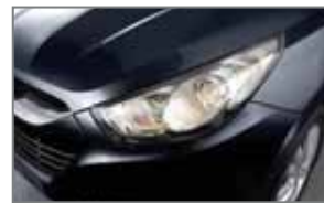
Piston Grey 5K