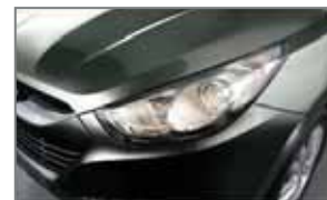
Shannon Green SHG