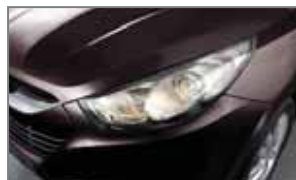
Cool Brown WBB