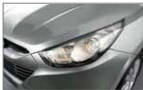
Sirius Silver AA3