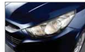
Oil Blue B6